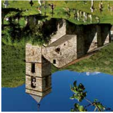
Sant Feliu de Barruera