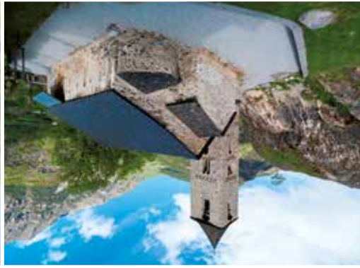
Sant Joan de Boí