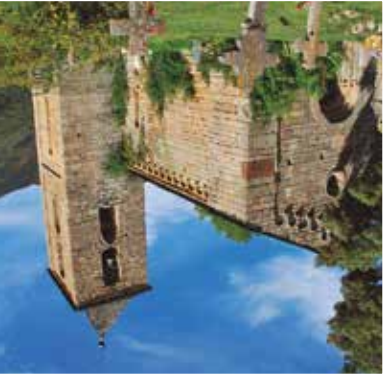
l'Assumpció de Coll