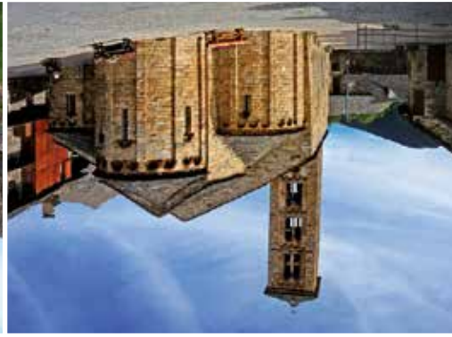
Santa Maria de Taüll