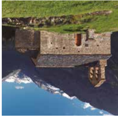
Sant Quiric de Durro