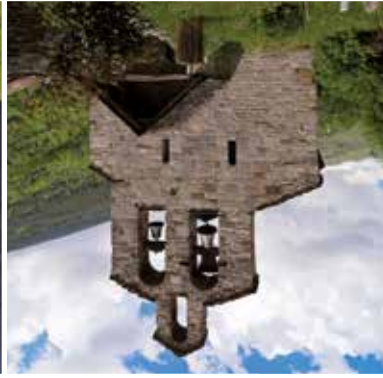
Santa Maria de Cardet